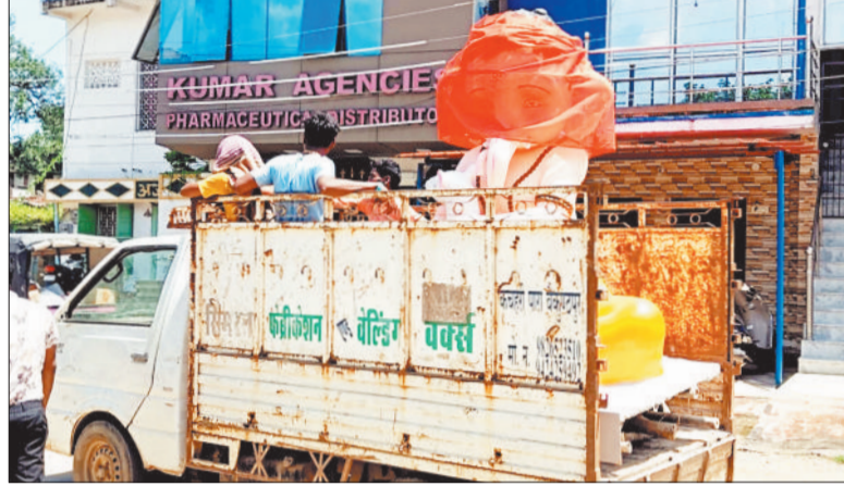
दोल नगाड़ों की धून पर ऐसे ले गई पूजा समितियां।

कोरिया समेत एमसीबी जिला बुधवार को गणेश चतुर्थी के अवसर पर पूरा गणेश भक्ति में डूब गया। शहर से लेकर गांव-गांव तक भगवान गणेश की प्रतिमाओं की स्थापना धूमधाम से हुई। शुभ मुहूर्त में जैसे ही गणपति बप्पा की प्रतिमाएं पंडालों में विराजित हुईं, गणपति बप्पा मोरया के जयकारों से पूरा वातावरण गूंज उठा। त्योहार को लेकर दो-तीन दिन पहले से ही पूजा समितियों और भक्तों की चहल-पहल मूर्तिकारों के घरों और कार्यशालाओं में देखी जा रही थी। 26-27 अगस्त को दोपहर से लेकर देर शाम तक मूर्तियां लेने वालों की भीड़ लगी रही। लोग अपनी बारी का इंतजार करते हुए खुशी-खुशी मूर्तियां वाहन पर लादते नजर आए। ट्रैक्टर, पिकअप और बाइकों पर सवार होकर गणेश प्रतिमा को शेष पेज 4 पर