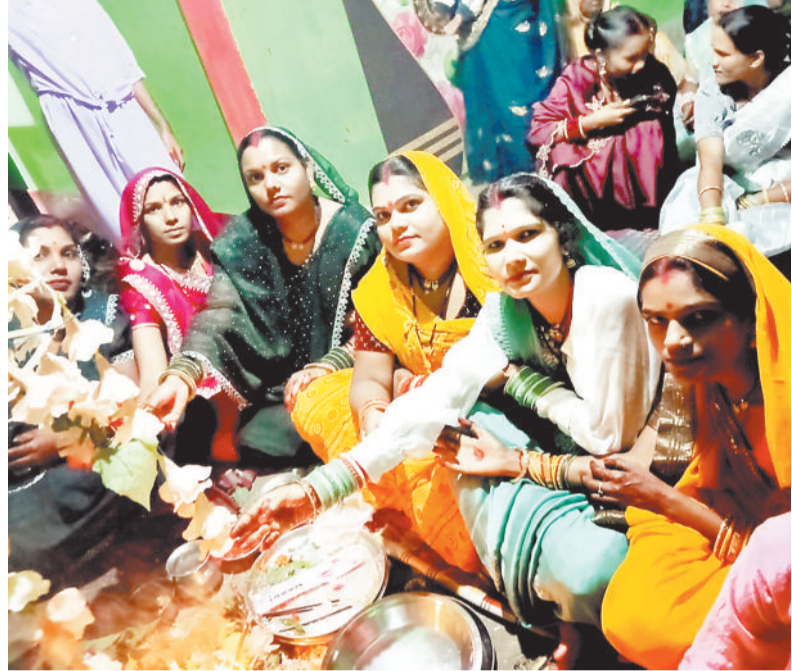
पूजा-अर्चना करती महिलाएं।

बिजुरी। माद्रपद शुक्ल पक्ष की तृतीया तिथि पर मनाया जाने वाला हरतालिका तीज का व्रत इस वर्ष भी नगर व आसपास के क्षेत्रों में बड़े धूमधाम और श्रद्धा-मवित के साथ संपन्न हुआ। पति की लंबी आयु, सुखमय दंपत्य जीवन और परिवार की समृद्धि की कामना को लेकर विवाहित महिलाओं ने दिनभर निर्जल उपवास रखा। वहीं अविवाहित कन्याओं ने भी इस पर्व में भाग लेकर भगवान मोलेनाथ से मनचाहे वर की प्राप्ति के लिए प्रार्थना की। सुबह से ही महिलाओं का समूह स्थानीय नदी-घाटों, मंदिरों व पवित्र स्थलों पर जुटा। विधि-विधान से स्नान कर उन्होंने भगवान शिव और माता पार्वती की पूजा-अर्चना की। पूजा के बाद सभी ने निर्जला व्रत का संकल्प लिया, जिसमें पूरे दिन बिना जल ग्रहण किए उपवास किया जाता है।